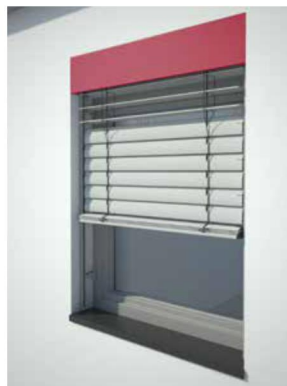
Winkelblende in der Laibung

Für Ihren Raffstore können Sie aus drei verschiedenen Blendentypen wählen und diese in Ihrer Wunschfarbe beschichten lassen. Die Farbauswahl treffen Sie ohne Mehrpreis aus den 650 Reflexa Wohnfühlfarben. Somit passt sich der Raffstore optimal an Ihre Fassade an und setzt bei Bedarf farbliche Akzente oder integriert sich in ein harmonisches Gesamtbild.