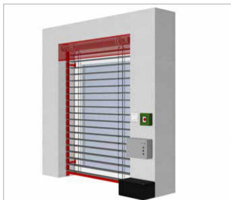
EL 80N NRS E