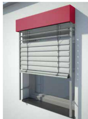
U-Kanalblende auf der Fassade