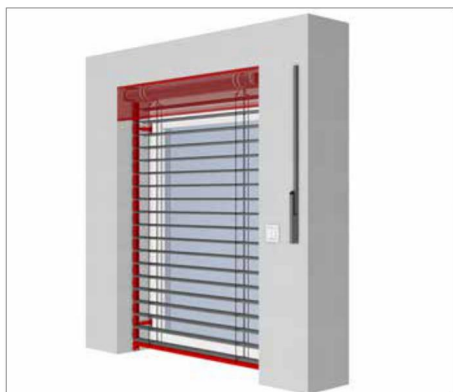
EL 80N NRS