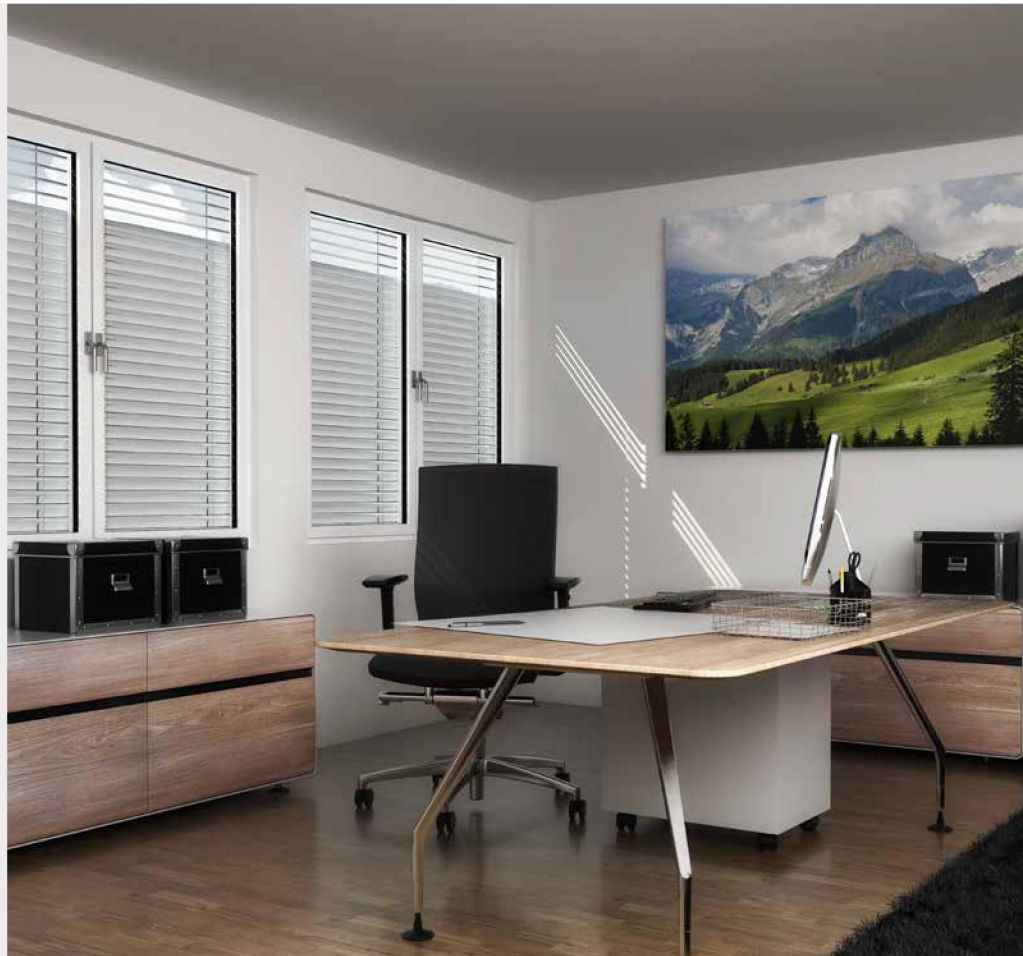
Abbildung: Einsatz der Lichtleittechnik

Im unteren Bereich schließen die Lamellen das Sonnenlicht aus, im oberen Drittel sind sie leicht geöffnet und sorgen dafür, dass sich das Tageslicht an der Decke verteilt und von dort gleichmäßig in den Raum abstrahlt.