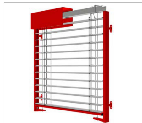
EL 80N WS